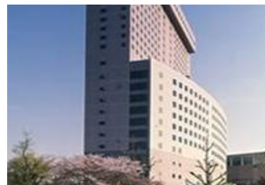
Kホテル（東京都）47,372m 2 省エネコンサルタント