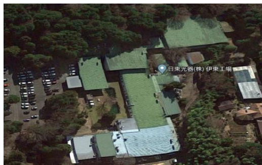
N工場（静岡県）7,500m 2 恒温恒湿空調、コンプレッサ、チ ラー工事 補助率1/3