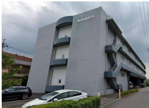
M倉庫（埼玉県）3,400m 2 LED工事