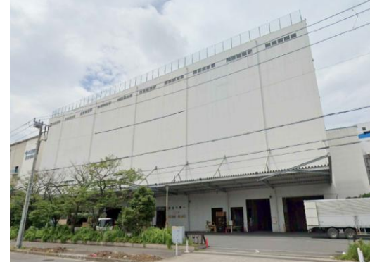
Y倉庫（東京都）7,800m 2 LED工事