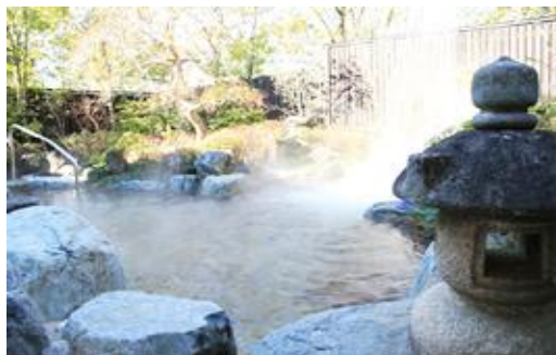
Sリゾート（茨城県）4,242m 2 露天風呂熱回収、空調、LED 給湯、EMS工事 補助率1/2