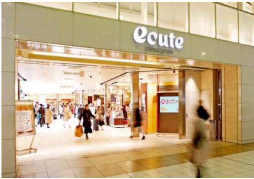
E商業施設（東京都）18,307m 2 省エネコンサルタント