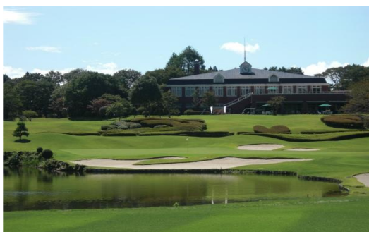
Fゴルフクラブ（栃木県）3,928m 2 バイオマスボイラ、空調、LED 太陽光、Low-e複層ガラス工事 補助率2/3 ZEB事業