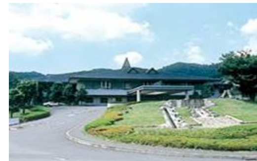
Sゴルフクラブ（栃木県）4,330m 2 空調、LED、発電機、EMS工事 補助率1/2