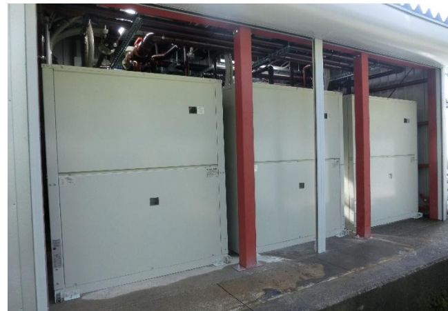
熱回収ヒートポンプチラー