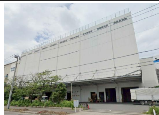
Y倉庫（東京都）7,800m 2 LED工事