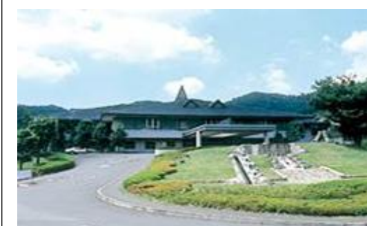
SJゴルフクラブ（栃木県）4,330m 2 空調、LED、発電機、EMS工事 補助率1/2