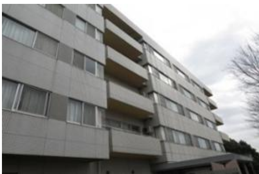
D病院（東京都）8,250m 2 空調、コジェネ工事 補助率1/2 ESCO事業