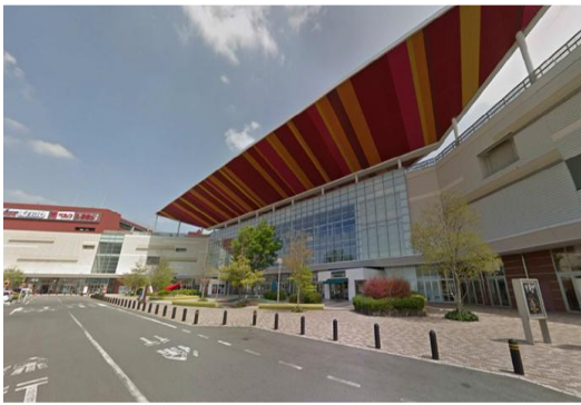
S商業施設（群馬県）88,860m 2 省エネコンサルタント