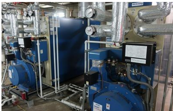
ボイラ・ガス給湯器・コジェネ・エコキュート