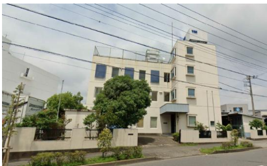
Y工場（東京都）1,351m 2 空調、コンプレッサ、チラー、受変 電設備工事 補助率3/4