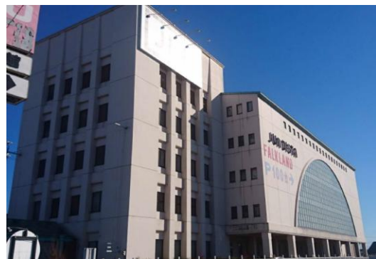
F商業施設（茨城県）6,600m 2 空調工事