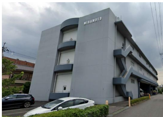
M倉庫（埼玉県）3,400m 2 LED工事