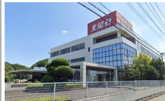
H工場（埼玉県）6,909m 2 空調、LED工事 補助率1/3