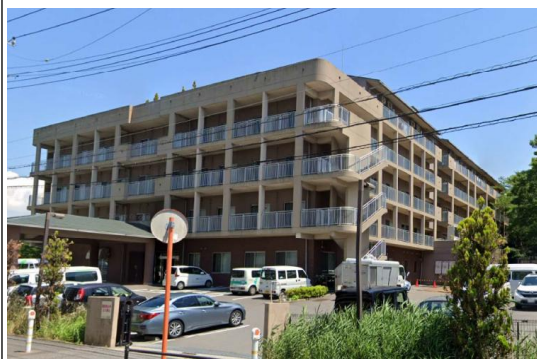
M老健施設（千葉県）10,328m 2 空調、受変電設備工事