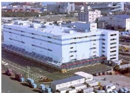
T物流（東京都）327,993m 2 省エネコンサルタント 全15棟