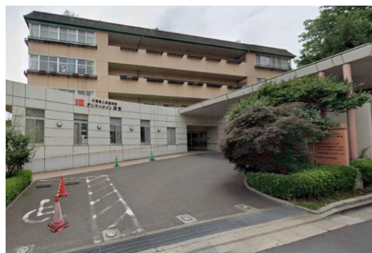
D老健施設（東京都）6,333m 2 空調、コジェネ工事 補助率1/2 ESCO事業