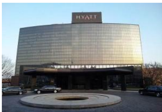
Gホテル（ソウル市）62,156m 2 リニューアル計画・監理