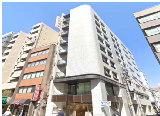
Sビル（東京都）4,656m 2 空調、LED工事 補助率1/2