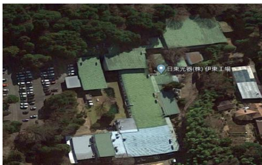
N工場（静岡県）7,500m 2 恒温恒湿空調、コンプレッサ、チ ラー工事 補助率1/3