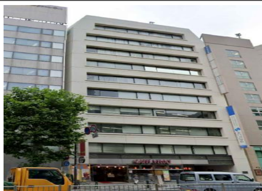
Sビル（東京都）3,341m 2 空調、LED工事 補助率1/2