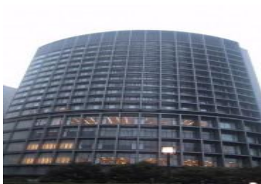
Gホテル（東京都）26,391m 2 省エネコンサルタント