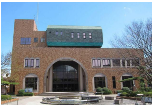
C大学（千葉県）62,685m 2 事業調査、LED工事 補助率1/2 省エネ大賞受賞