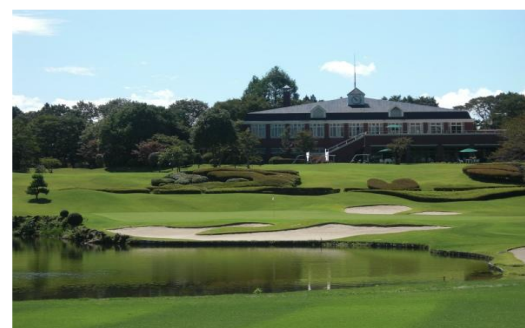
FJゴルフクラブ（栃木県）3,928m 2 バイオマスボイラ、空調、LED 太陽光、Low-e複層ガラス工事 補助率2/3 ZEB事業