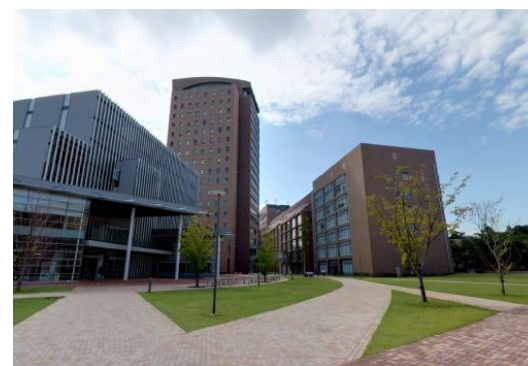
W大学（千葉県）45,000m 2 LED、電源工事