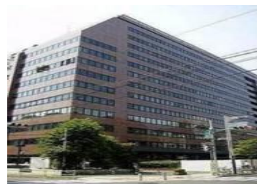
Sビル（東京都）102,321m 2 省エネコンサルタント