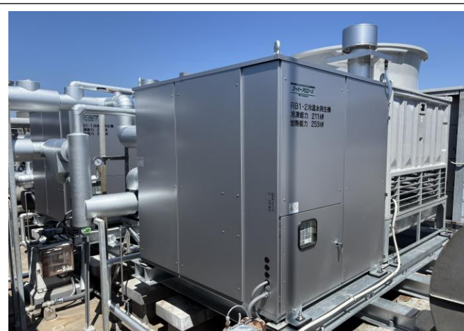
冷温水器・チラー