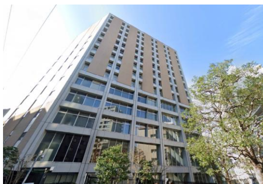
T大学（東京都）19,232m 2 空調、LED工事 補助率1/2