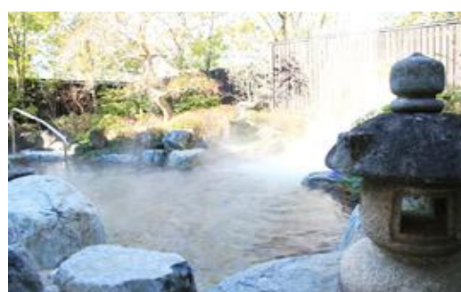
Sリゾート（茨城県）4,242m 2 露天風呂熱回収、空調、LED 給湯、EMS工事 補助率1/2