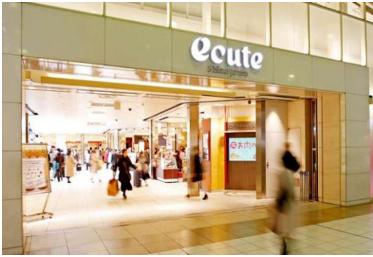
E商業施設（東京都）18,307m 2 省エネコンサルタント