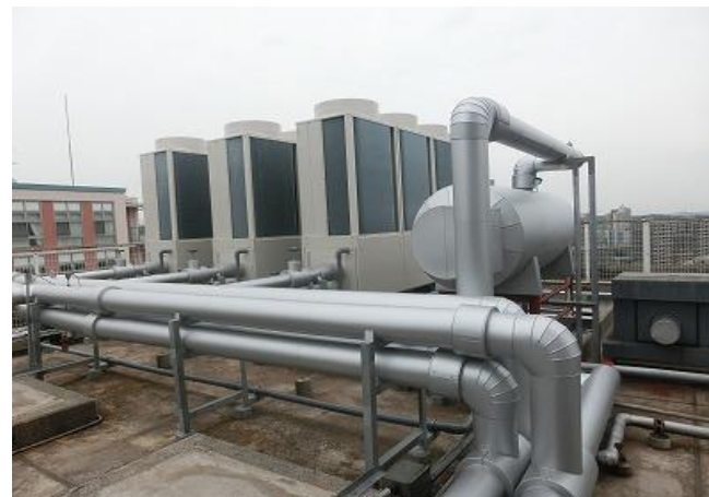
空冷ヒートポンプチラー