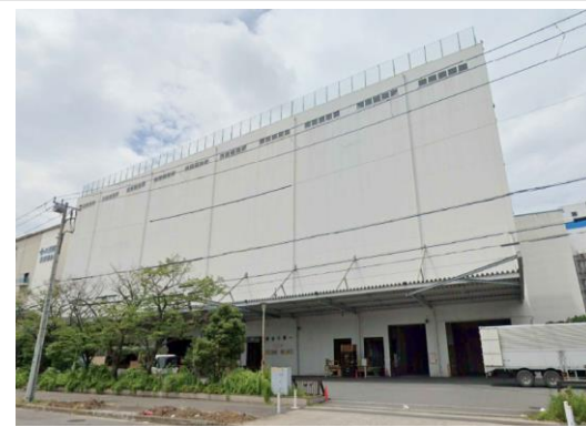
Y倉庫（東京都）7,800m 2 LED工事