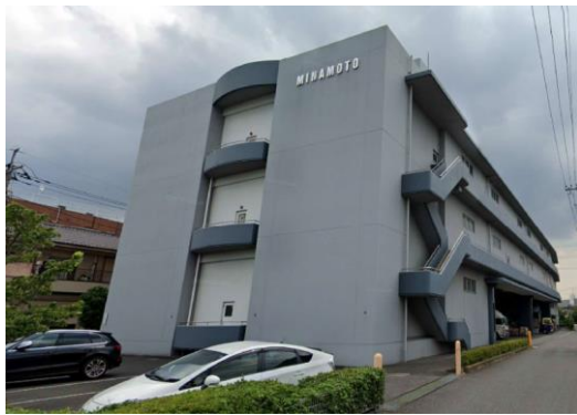
M倉庫（埼玉県）3,400m 2 LED工事