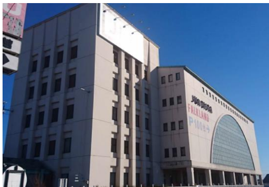
F商業施設（茨城県）6,600m 2 空調工事