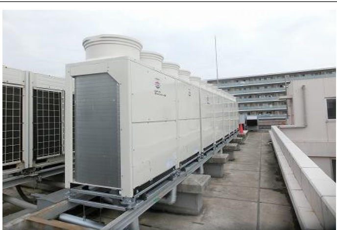
空冷ヒートポンプパッケージ（ビルマル）