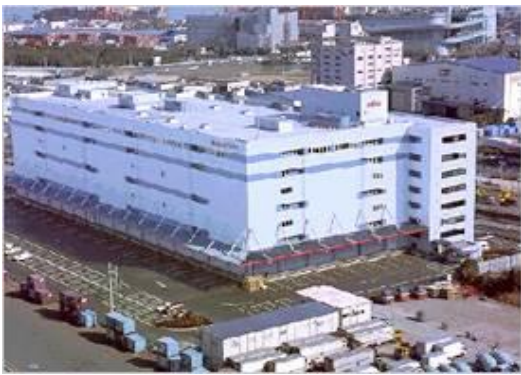
T物流（東京都）327,993m 2 省エネコンサルタント 全15棟