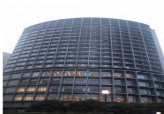
Gホテル（東京都）26,391m 2 省エネコンサルタント