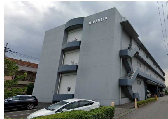
M倉庫（埼玉県）3,400m 2 LED工事