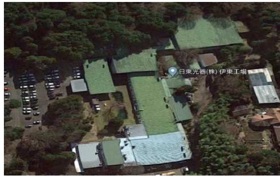
N工場（静岡県）7,500m 2 恒温恒湿空調、コンプレッサ、チ ラー工事 補助率1/3