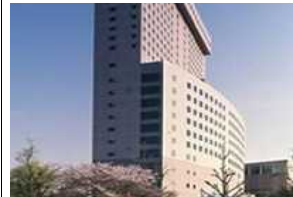
Kホテル（東京都）47,372m 2 省エネコンサルタント