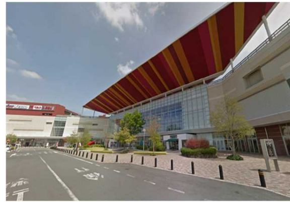
S商業施設（群馬県）88,860m 2 省エネコンサルタント