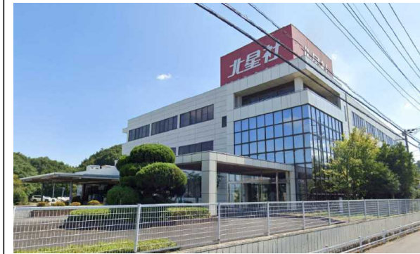
H工場（埼玉県）6,909m 2 空調、LED工事 補助率1/3