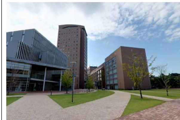
W大学（千葉県）45,000m 2 LED、電源工事