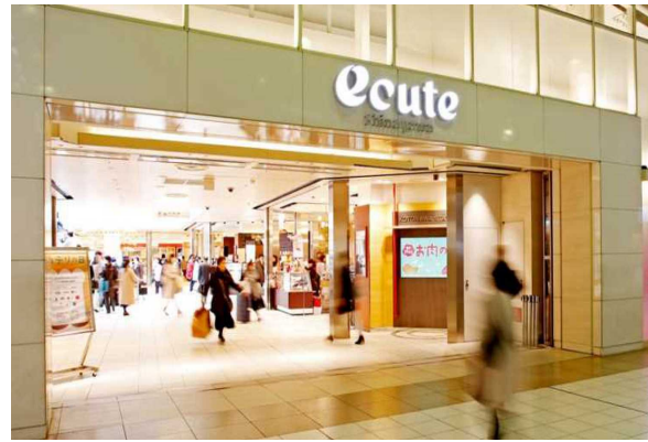
E商業施設（東京都）18,307m 2 省エネコンサルタント