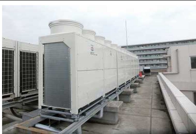
空冷ヒートポンプパッケージ（ビルマル）