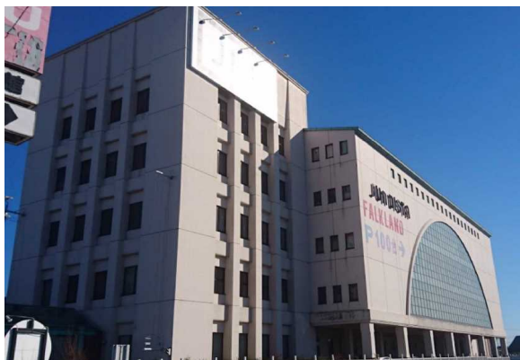
F商業施設（茨城県）6,600m 2 空調工事