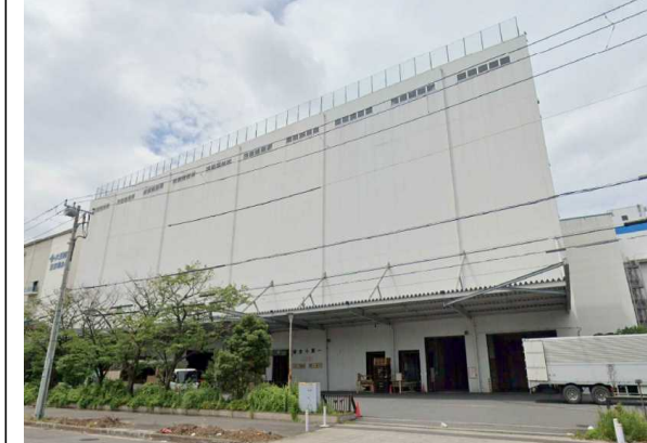
Y倉庫（東京都）7,800m 2 LED工事