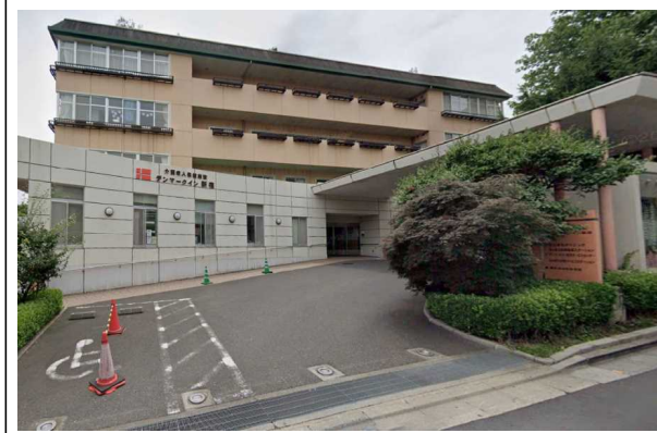
D老健施設（東京都）6,333m 2 空調、コジェネ工事 補助率1/2 ESCO事業