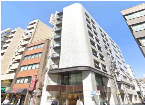
Sビル（東京都）4,656m 2 空調、LED工事 補助率1/2