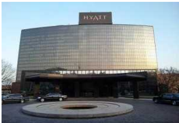
Gホテル（ソウル市）62,156m 2 リニューアル計画・監理