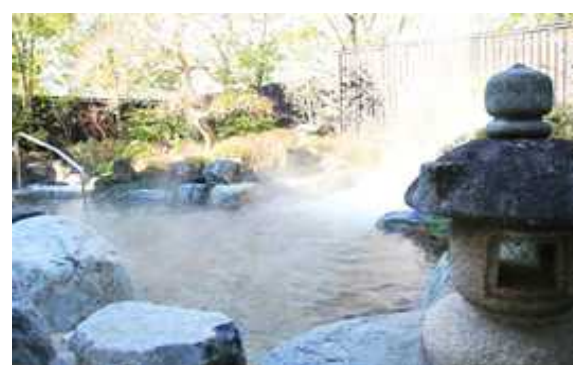
Sリゾート（茨城県）4,242m 2 露天風呂熱回収、空調、LED 給湯、EMS工事 補助率1/2