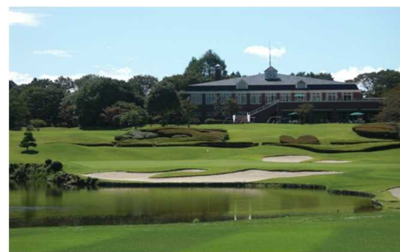
Fゴルフクラブ（栃木県）3,928m 2 バイオマスボイラ、空調、LED 太陽光、Low-e複層ガラス工事 補助率2/3 ZEB事業