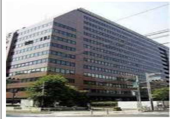
Sビル（東京都）102,321m 2 省エネコンサルタント