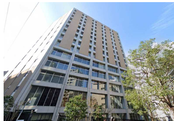
T大学（東京都）19,232m 2 空調、LED工事 補助率1/2