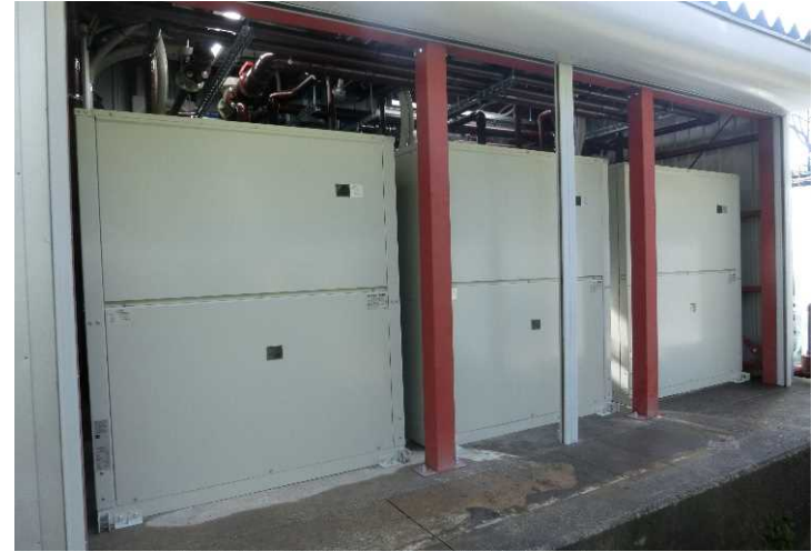
熱回収ヒートポンプチラー