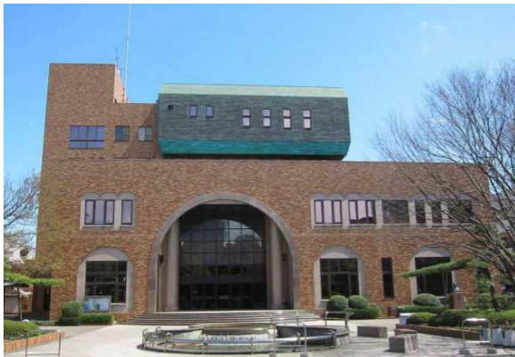
C大学（千葉県）62,685m 2 事業調査、LED工事 補助率1/2 省エネ大賞受賞