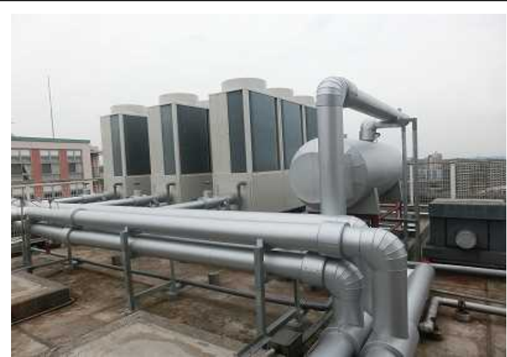
空冷ヒートポンプチラー