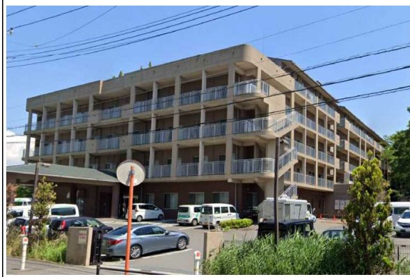
M老健施設（千葉県）10,328m 2 空調、受変電設備工事