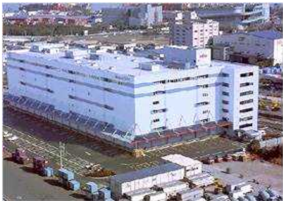
T物流（東京都）327,993m 2 省エネコンサルタント 全15棟