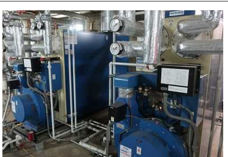
ボイラ・ガス給湯器・コジェネ