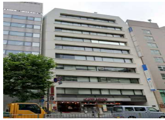
Sビル（東京都）3,341m 2 空調、LED工事 補助率1/2