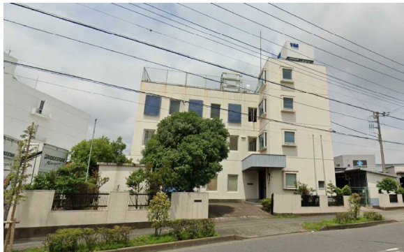
Y工場（東京都）1,351m 2 空調、コンプレッサ、チラー、受変 電設備工事 補助率3/4