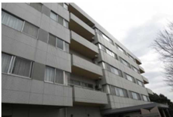
D病院（東京都）8,250m 2 空調、コジェネ工事 補助率1/2 ESCO事業