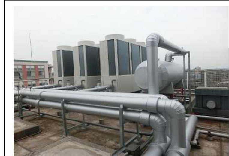
空冷ヒートポンプチラー