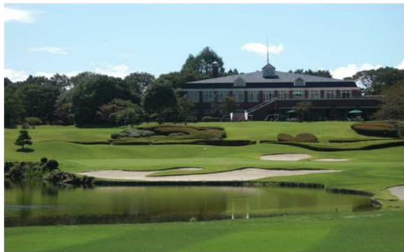
58GC（栃木県）3,928m 2 バイオマスボイラ、空調、LED 太陽光、Low-e複層ガラス工事 補助率2/3 ZEB事業