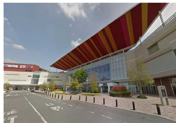
S商業施設（群馬県）88,860m 2 省エネコンサルタント