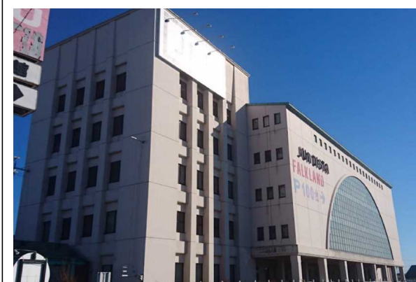
F商業施設（茨城県）1,100m 2 LED工事