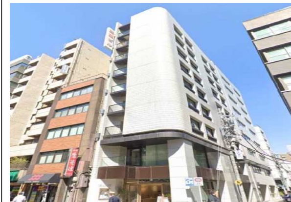
Sビル（東京都）4,656m 2 空調、LED工事 補助率1/2