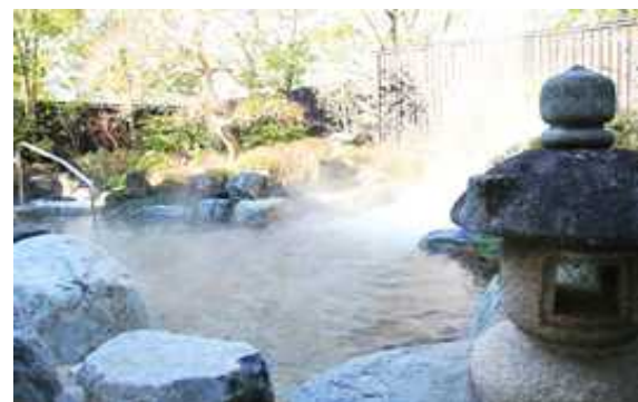
Sリゾート（茨城県）4,242m 2 露天風呂熱回収、空調、LED 給湯、EMS工事 補助率1/2