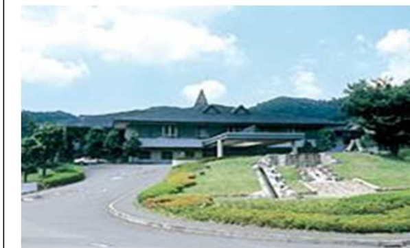
佐野GC（栃木県）4,330m 2 空調、LED、発電機、EMS工事 補助率1/2