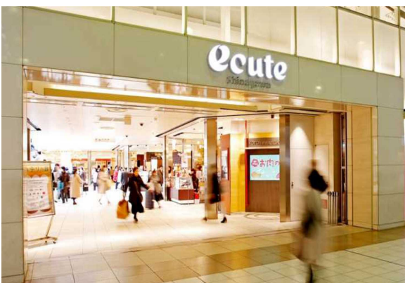
E商業施設（東京都）18,307m 2 省エネコンサルタント