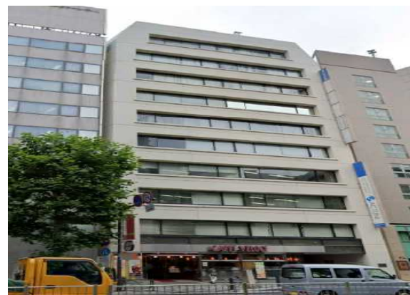
Sビル（東京都）3,341m 2 空調、LED工事 補助率1/2