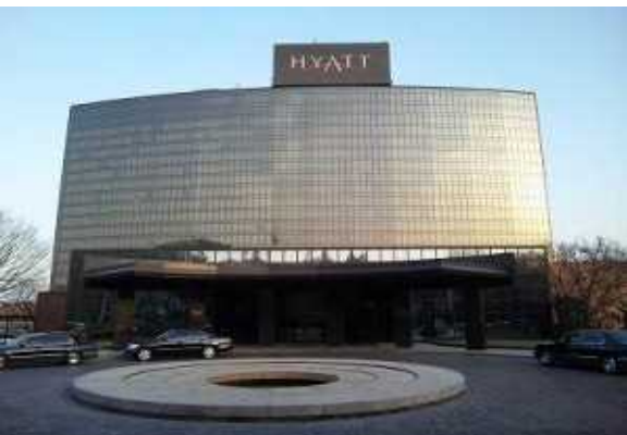
グランドハイアットソウル （韓国ソウル市）62,156m 2 リニューアル計画・監理